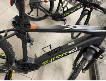
Damenbike : NR. 1067