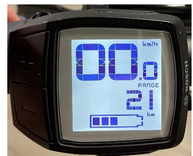
Range (=Reichweite Modus bezogen)