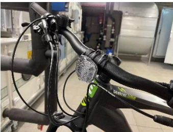
Reflektor vorne ok