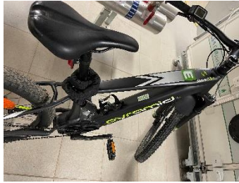
Herrenbike : NR. 1015